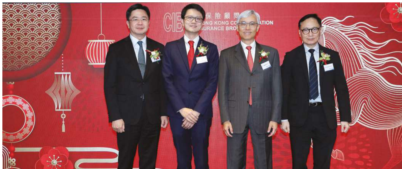
聯會會長史千里先生、主禮嘉賓保監局主席姚建華先生及兩位貴賓：立法會保險界議員陳沛良先生和保監局行政總監張雲正先生。