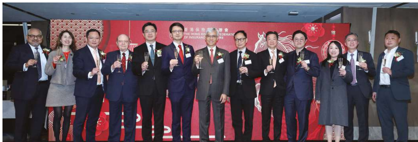
聯會常務委員會成員和嘉賓一同舉杯祝願，迎接豐碩富足的馬年。