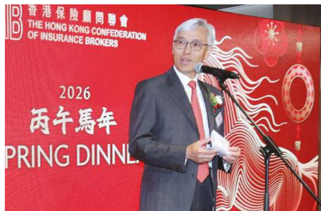
主禮嘉賓保監局主席姚建華先生致開幕辭，讚揚聯會和保監局的良好合作關係。